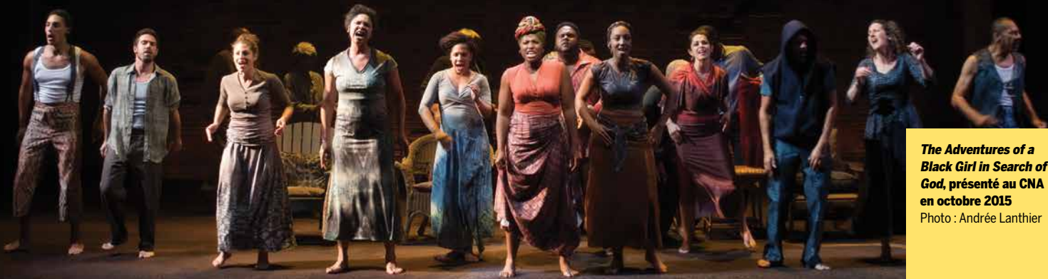
The Adventures of a Black Girl in Search of God, présenté au CNA en octobre 2015

Tout le monde au Théâtre anglais est reconnaissant aux partenaires du CNA qui ont rendu possible la création de ce programme. « Merci de nous aider à braquer les projecteurs sur ces talents sous-représentés. »