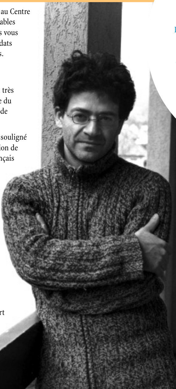
Wajdi Mouawad, le nouveau directeur artistique du Théâtre français du CNA, concevra cette année sa première saison théâtrale qui sera lancée à l'automne 2008.