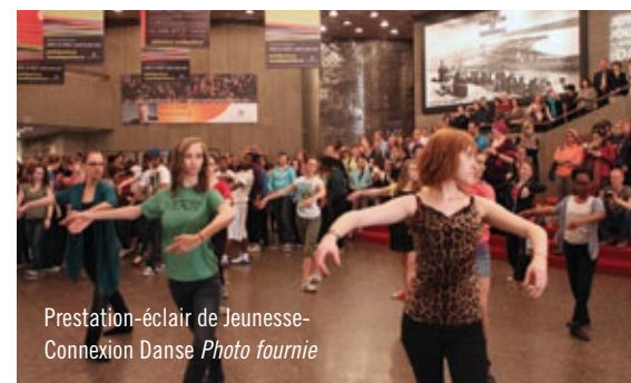
Prestation-éclair de Jeunesse- Connexion Danse Photo fournie

Danse CNA administre une initiative appelée Jeunesse connexion-danse, qui permet à un groupe d'adolescents d'explorer l'univers de la danse et d'apprécier cette forme d'art. Chaque année, les participants s'engagent dans un projet qui les amène à faire preuve de leadership. Les jeunes sélectionnés pour