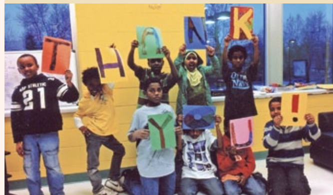
Mot de remerciements du Club des garçons et filles d'Ottawa

Demeurez à l'affût pour de nouvelles informations au sujet de Partager l'esprit . Entre-temps, pour en savoir plus long sur la façon dont vous pouvez aider à offrir un temps des Fêtes empli de magie, composez le 613-947-7000, poste 315.