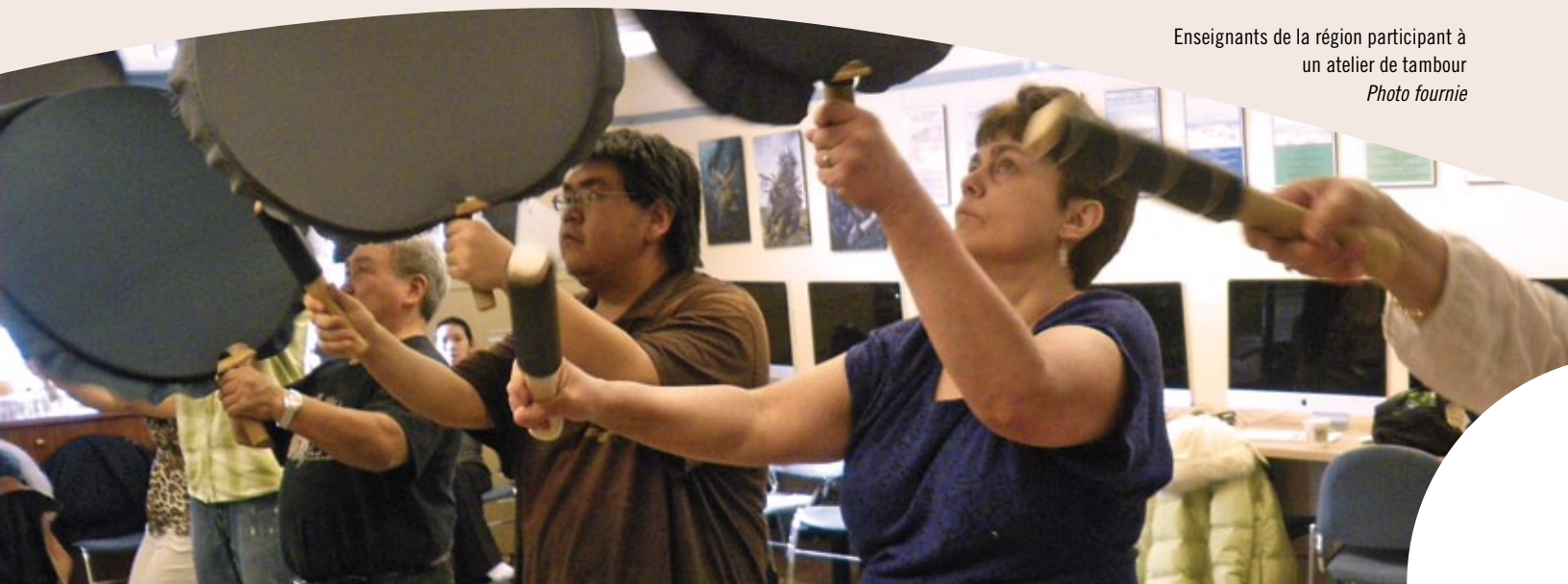
Enseignants de la région participant à un atelier de tambour

En 2011-2012, le CNA compte introduire le programme dans deux communautés supplémentaires, appuyer des programmes plus approfondis, et continuer à renforcer et à tirer parti des réussites passées, explique Natasha. Voilà pourquoi l'appui des donateurs est si important et apprécié. « Vos dons sont une occasion unique de faire une différence considérable et d'appuyer des communautés qui investissent en elles-mêmes et en l'avenir. »