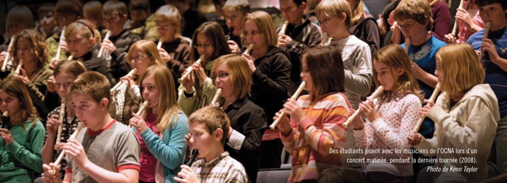
Des étudiants jouent avec les musiciens de l'OCNA lors d'un concert matinée, pendant la dernière tournée (2008).